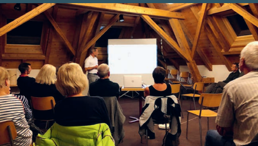
Notre directeur général lors d'une conférence publique sur la Zeidlerei (apiculture forestière ancestrale).

Nous avons maintenu les cours standard – les cours d'introduction et de perfectionnement – dont le nombre a fortement augmenté en 2020, au même niveau élevé que l'année précédente. Il en va de même pour les conférences publiques.