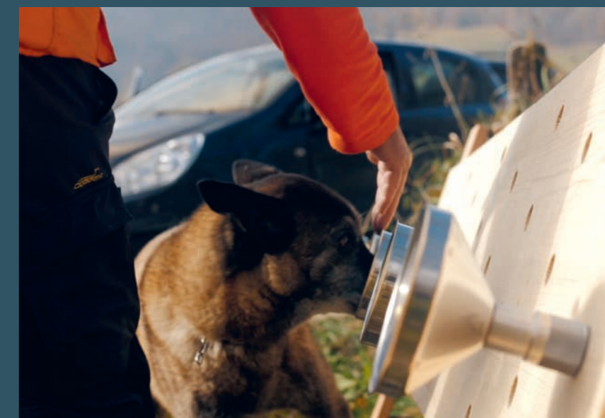
Formation de chien indicateur pour la détection précoce de la loque européenne et de la loque américaine dans les colonies d'abeilles.

Le projet était partiellement financé et les charges se sont accumulées. Les objectifs ont néanmoins pu être largement atteints. Dans un projet aussi nouveau et innovant, il faut s'attendre à des inconnues et à des imprévus. Nous sommes fiers de nos progrès et de nos réalisations et nous allons poursuivre le projet et le mener à bien.