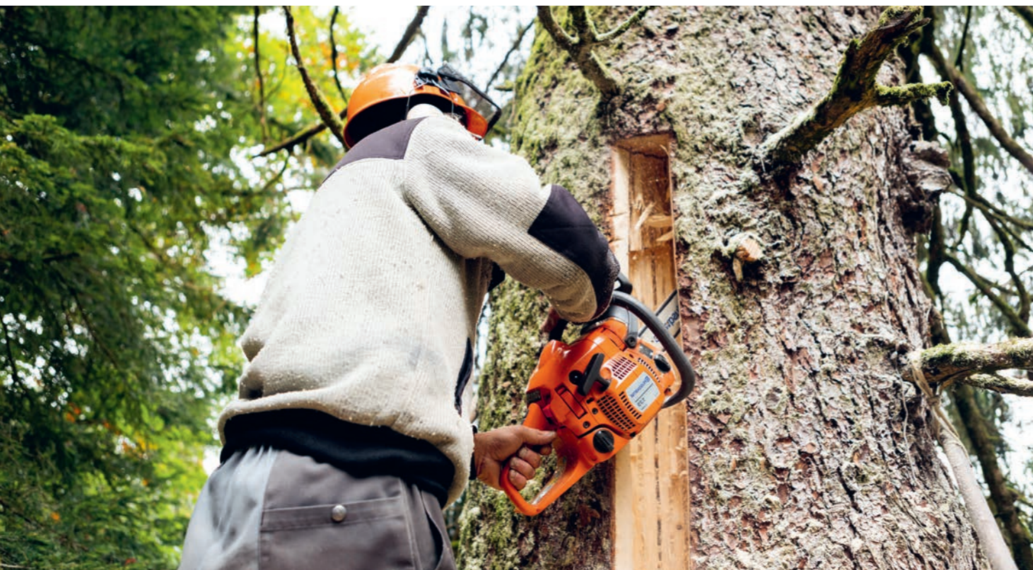
Maître Zeidler en train de creuser un épicea selon la technique « Zeidlerei ».

stant d'un projet à caractère fortement artisanal. Cependant, étant donné qu'à l'avenir, les cavités des arbres seront surveillées au moyen du projet Swiss BeeMapping décrit ci-dessus et que des projets de recherche scientifique super intéressants peuvent être mis en place sur l'infrastructure, les plus de 100 colonies d'abeilles sauvages connues et les 335 habitats de cavités d'arbres