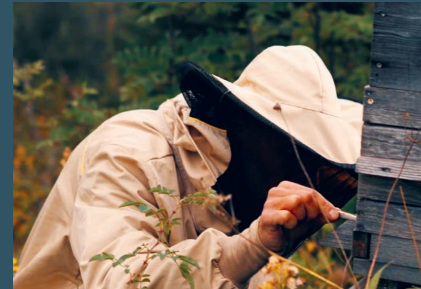
Prélèvement d'échantillons à l'entrée de la ruche.

La prochaine étape consistera à faire appel à un professionnel afin de fournir des preuves scientifiquement correctes de la spécificité et de la sensibilité de la méthode d'analyse. Une première présentation des chiens à la conférence des vétérinaires cantonaux a malheureusement dû être reportée à court terme à 2022 en raison des mesures Covid.