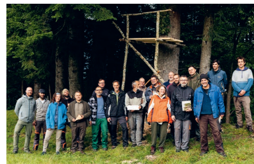
La technique de la Zeidlerei du Moyen-Âge pour créer des cavités d'arbres importantes sur le plan écologique et de la biodiversité.